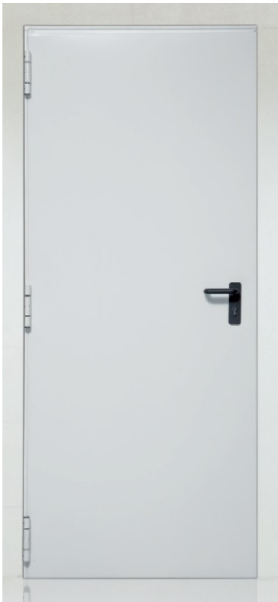
SLIKA METALNIH VRATA "TWIN" U STANDARDNOJ BOJI