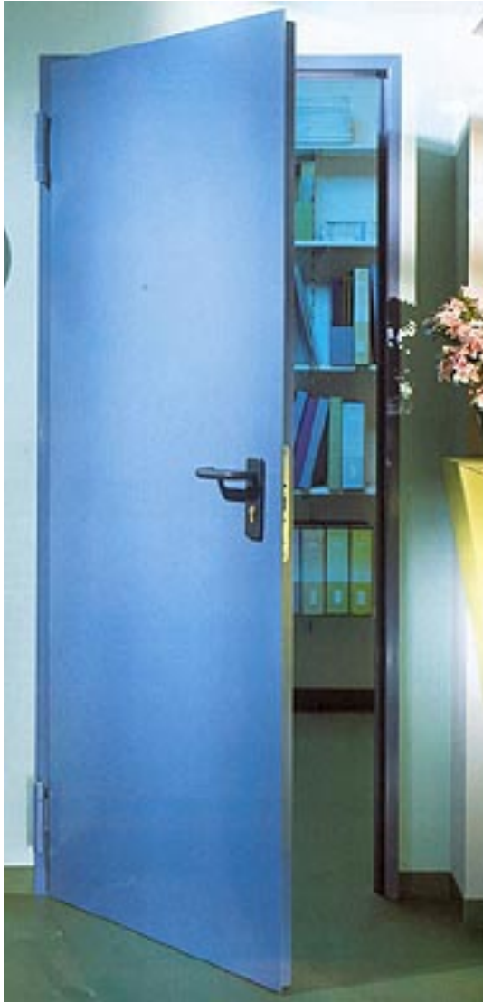
SLIKA METLANIH VRATA "MULTIPLA 1B" U BOJI RAL 5012